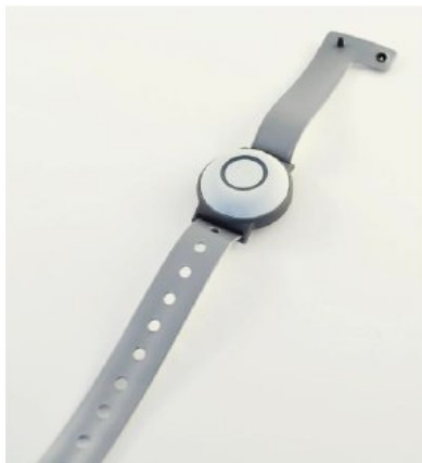
Voorbeeld van de sleutelband

Vivent Berlerode is voor iedereen die er woont en werkt toegankelijk. Dat houdt in dat alle deuren open zijn, behalve de buitendeur (hoofdingang) en de voordeur van de woningen. Als het voor een bewoner of diens leefomgeving veiliger is om zich binnen één of meerdere leefcirkels te bewegen, dan zorgen we hiervoor. Vivent maakt daarbij gebruik van speciale sleutelbandjes. In dit sleutelbandje zit een zendertje, dat gekoppeld is aan de bewoner die het sleutelbandje om de pols draagt. In elke deur naar een andere leefcirkel zit een ontvanger ingebouwd. Deze ontvanger krijgt een uniek signaal vanuit de sleutelband van een naderend persoon. De deur 'vraagt' dus ongemerkt aan het systeem of er voor deze specifieke persoon een beperking is ingesteld. Als dat zo is, dan vergrendelt de deur zichzelf. Als er geen beperkingen zijn gevonden, dan blijft de deur gewoon open. Voor de ene bewoner kan dus de deur van de woning gesloten blijven, voor de ander de deur van de grote gemeenschappelijke ruimte (restaurant) met de lift en voor weer een ander de buitendeur. Het is zelfs mogelijk om de leefcirkel dagelijks voor een aantal uren groter of kleiner te maken.